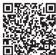
Syndrome des spasmes infantiles - Syndrome de West (2020)