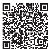
Syndrome malin des neuroleptiques (2017)