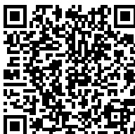
Artérite à cellules géantes - Maladie de Horton (2018)