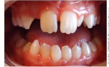
Patiente âgée de 10 ans hétérozygote pour une mutation EDA

Ces implants sont à tarif opposable et ne donnent pas lieu à un dépassement d'honoraires.