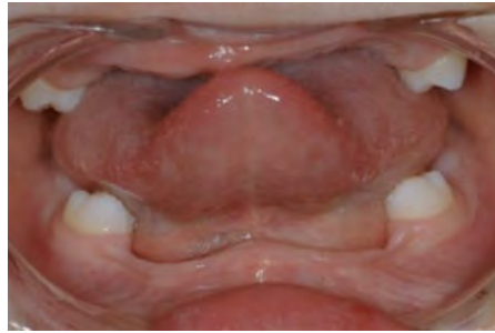
Patient présentant une forme sévère, illustrant bien le phénotype dentaire caractéristique, l'hypotrophie de la crête alvéolaire, et les indications de traitement implantaire précoce

Les jeunes filles ou femmes porteuses de la DEX ont des manifestations cliniques plus discrètes car elles ne sont atteintes que par un allèle muté du gène EDA : hypodontie (< 6 dents manquantes), microdontie d'une incisive latérale et signes dermatologiques mineurs (sourcils et/ou cheveux fins). Elles sont encore actuellement sous-diagnostiquées, alors qu'elles peuvent transmettre des formes sévères à leurs descendants mâles.