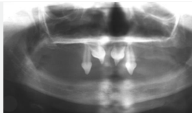
Radiographie panoramique d'un enfant de 6 ans présentant une oligodontie

Le diagnostic est tout d'abord clinique pour les DEA : les cheveux sont fins, l'enfant transpire peu ou pas du tout, la zone périorbitaire est hyper-pigmentée, le front bombé et l'arête nasale en selle. Les dents se caractérisent par un retard d'éruption et une morphologie atypique (incisives et canines conoïdes), avec un nombre d'agénésies dentaires important (en denture temporaire et permanente), menant à une oligodontie, voire une anodontie dans les formes cliniques les plus sévères.